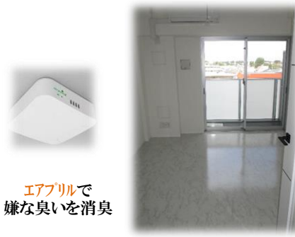
エアプリルで嫌な臭いを消臭