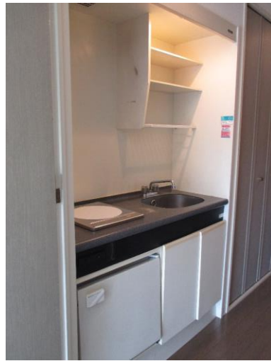
※短期解約違約金有(1年以内) ※図面と現況が異なる場合現況優先となります。

◆専有面積 ◆間取り ◆賃料 ◆共益費 19.66㎡ 1K ¥34,000 ¥3,000