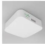
エアブリルで 嫌な臭いを消臭